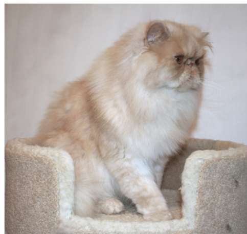
CH / GCCF GC Silverdance Amadeus