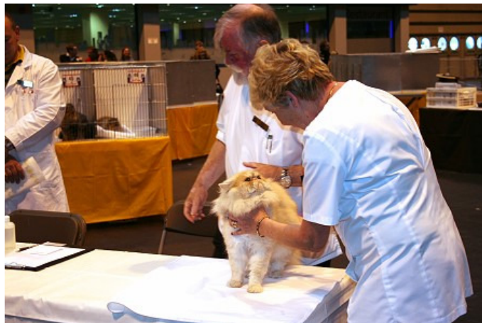
CH / GCCF GC Silverdance Amadeus im Best Variety Ring

Gegen 14:00 Uhr beginnt die Show Best Variety. Alle Best of Breed Perser Erwachsen starten gegeneinander in einem Ring. Doch nur eine Katze gewinnt das begehrte Best of Variety.